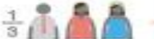
Residentes de CLT