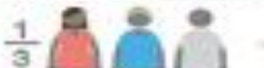
Miembros de la comunidad